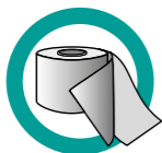
BANDE DE JOINTURE AUTO-ADHÉSIVE