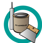
COLLE MONOCOMPOSANT ET SPATULE