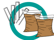
AGRAFES DE FIXATION ET SABLE