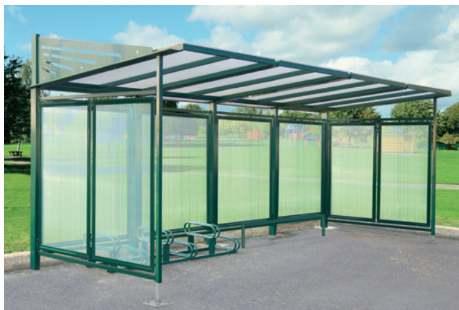
Réf. 529614 + 204105 + 204711