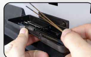
Compartment de stockage des lames Compartment for blade storage