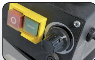
Variateur de vitesse (500-1700 tr/min) Speed variator (500-1700 tr/min)