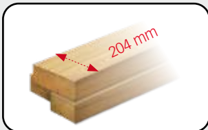
Idéal pour les bastinges Ideal for the bastinges