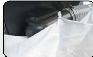
Sac de récupération des copeaux Dust collection bag