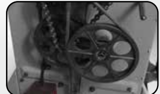
Système d'entraînement par courroie Belt driven system