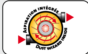
Système d'aspiration intégré Dust wizard inside