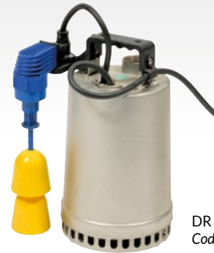
DR STEEL 25 F.V Code : 137607

Pompes submersibles en acier INOX 304 pour eaux claires ou peu chargées