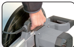
Poignée de transport Carrying handle