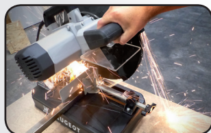
Pare-étincelles pour plus de sécurité Spark screen for safety use